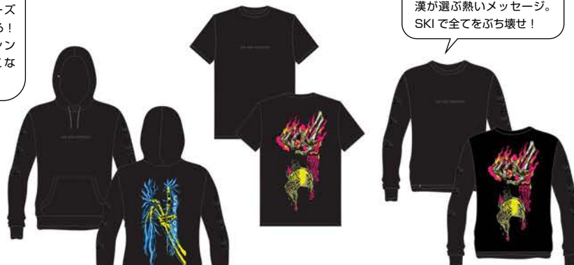
SKI & DESTROY TEE ¥4,950 (税込)

とにかく全開フルスピードでシーズンを駆け抜けろ! 毎日着られるシンプルで飽きのこないデザイン。