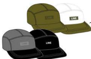
ONWARD 5-PANEL CAP ¥3,850 (税込)

私たちは後ろ向きに滑ったりもしますが、常に進んでいます。この帽子なら、ツバがついているので進行方向がわかりやすいですね。内側にはフリースの裏地が付いていて快適に使えます。