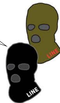
HEIST SKI MASK ¥3,300 (税込)

山の上でのお見合いがうまくいかなかったとき、毎年恒例のスキー旅行で義理の家族から隠れようとしているとき、あるいはちょっと速く滑りすぎて黄色のコート(パトロール)を避けたいときに役立ちます。暖かさはもちろん、変装するためにも活用できます。