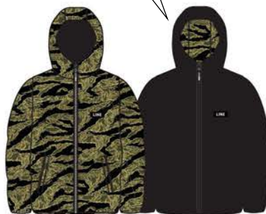
TOASTER PUFFY REVERSIBLE ¥16,500 (税込)

プレイの内容や目的地に関係なく、このリバーシブル・ジャケットでスタイルをアピールしよう。森の中で隠れるのにも最適なカモフラージュ柄。春の晴れた日、雪の日の散歩、霧雨の日、どんな天候にも対応します。