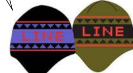
HEATHER BEANIE ¥2,750 (税込)

とにかく暖かいです。耳を覆うイヤーフラップが付いているので、寒い日でも快適に過ごせます。