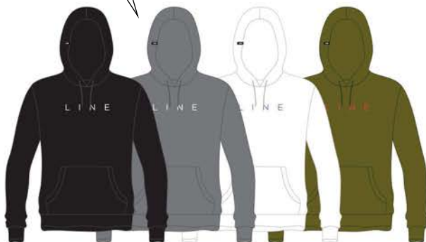
CORPO HOODIE ¥9,350 (税込)

このシンプルで洗練されたフーディで、あなたのLINE愛を表現してみてください。カラーはブラック、グレー、ホワイト、カーキの4色です。