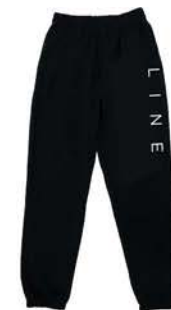
CORPO SWEAT PANTS ¥8,800 (税込)

滑り終わってウエアーを脱いでから、翌日にまたウエアーを着るまでの絶対必需品。他のスキーヤーに対して自分のLINE愛をアピールしよう。