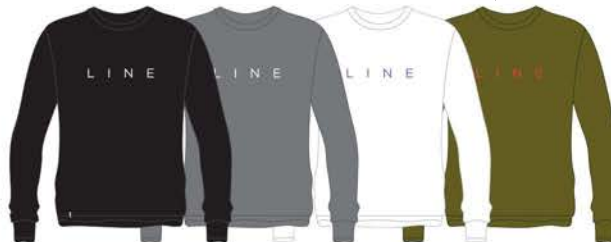
CORPO L/S TEE ¥5,280 (税込)

このシンプルで洗練されたデザインで、あなたのお気に入りのスキーブランドを表現してみてください。カラーはブラック、グレー、ホワイト、カーキの4色です。