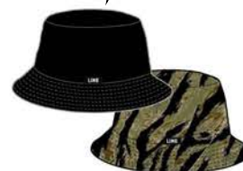
SHADY BUCKET HAT ¥3,850 (税込)

暖かな春の日、ロングハイク、滑った後のビール。さらにはビーチで過ごす一日でも、このハットのスタイルでクールに決めましょう。カラーはブラックとカモのリバーシブルです。