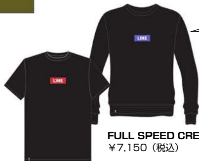
FULL SPEED TEE ¥4,950 (税込)