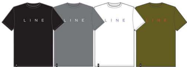
CORPO TEE ¥4,950 (税込)

オープンから取り出したばかりのピザのような (!?), フレッシュな気分になてくれるシンプルデザインのT-シャツです。ピザのシミにご注意ください。