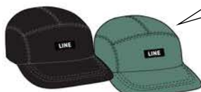
FOREVER 5-PANEL CAP ¥3,300 (税込)

シンプルな5パネルキャップです。ランチタイムや滑った後のビール、チルタイムには必需品ですね。カラーはブラックとグリーンの2色。